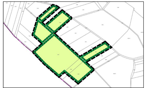
Ausschnitt Ausgleichsfläche A1