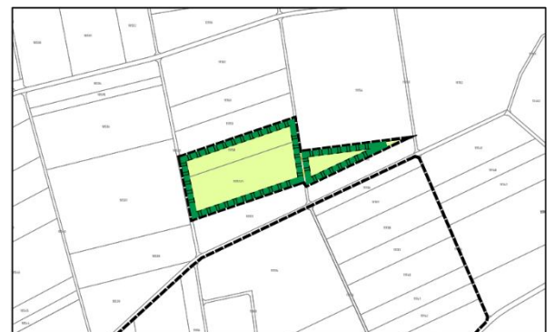
Ausschnitt Ausgleichsfläche A4