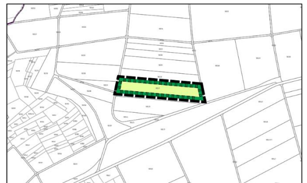
Ausschnitt Ausgleichsfläche A3