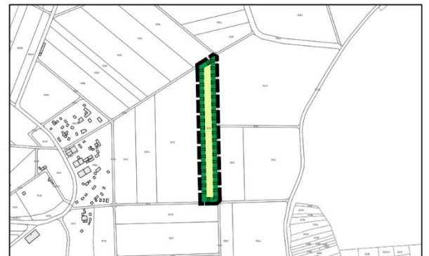
Ausschnitt Ausgleichsfläche A2