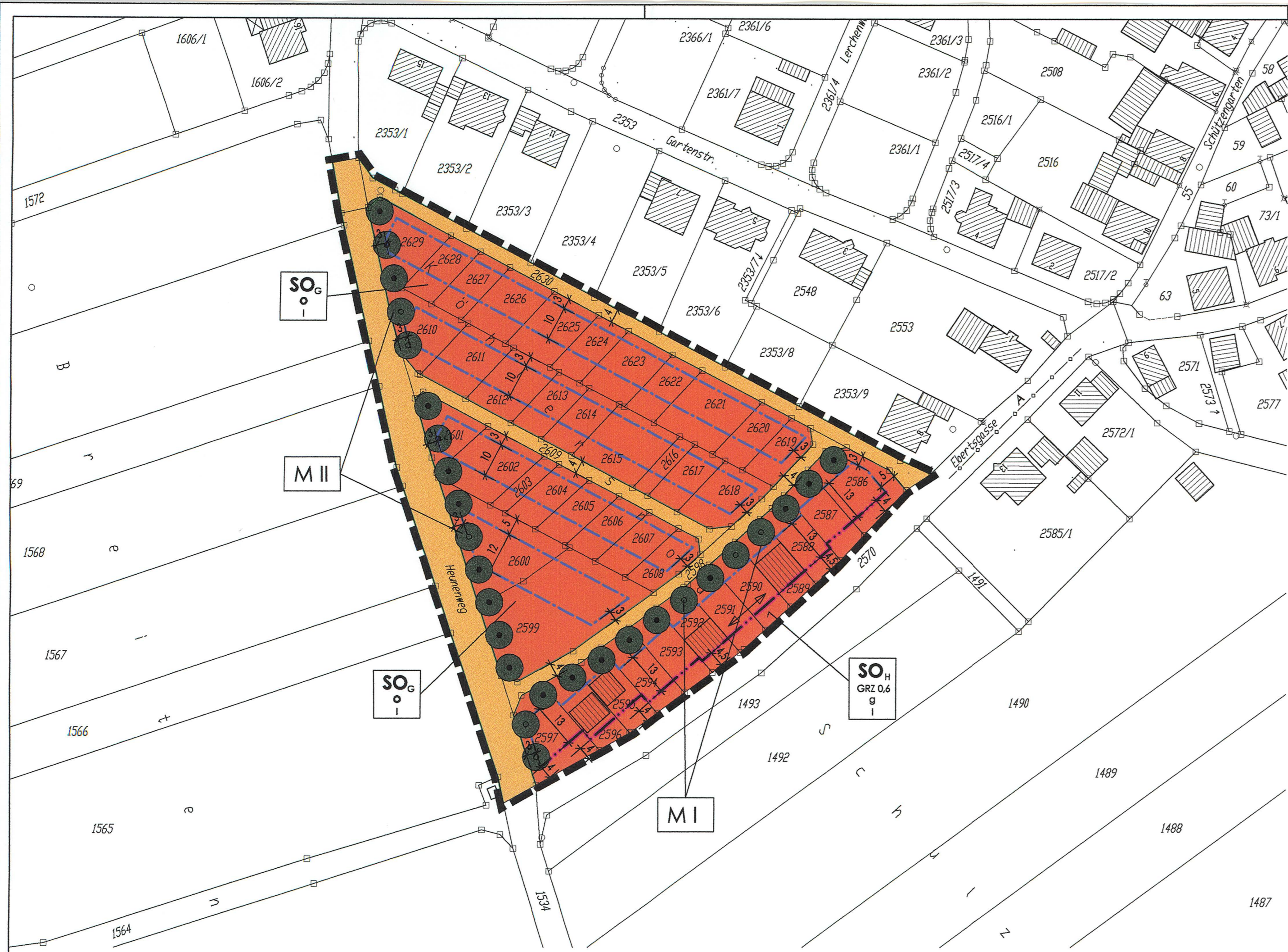
LAGEPLAN - BEBAUUNGSPLAN M. 1:1000